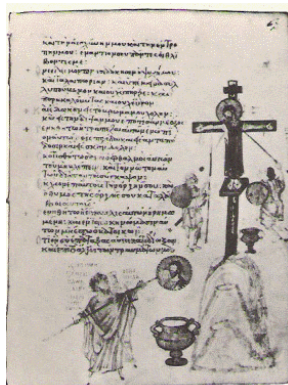
Psalterhåndskrift, der viser to billedstormere - i gang med at overkalke en Kristusikon

og forholdet mellem det menneskelige og guddommelige, man standser op over for og udtrykker skjult og symbolsk. En tydelig understregning af, at det netop er drøftelserne fra 4., 5. og 6. økumeniske kirkemøde, der fortsættes i drøftelserne af de hellige ikoner, som blev hovedtemaet på det syvende og sidste økumeniske koncil i 787.